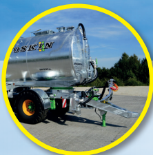
Tetraliner : Dolly et suspension à air