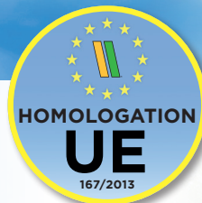
Homologation 34 t