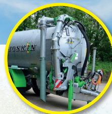
Avec ou sans bras de pompage