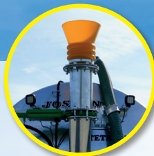
Entonnoir à l'arrière